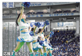
応援するチアリーダー

エイジェックスポーツ事業部のチアリーディング事業、今大会は出場5チームへのチア派遣を行っています！