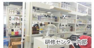
研修センター内部