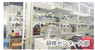
研修センター内部