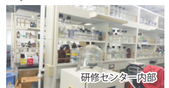
研修センター内部