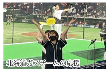
北海道ガスチームの応援