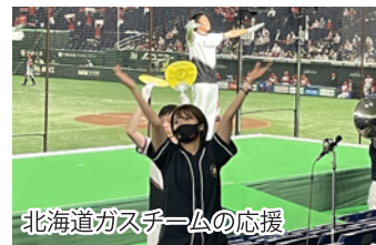
北海道ガスチームの応援