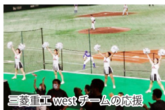
三菱重工westチームの応援