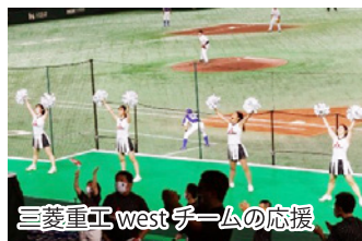
三菱重工westチームの応援