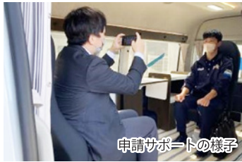
申請サポートの様子