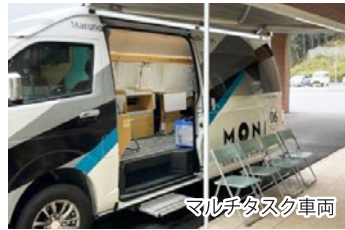
マルチタスク車両